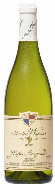
2015 Weißer Burgunder trocken

...das eigentliche Geheimnis eines besonderen Weines ist entschieden mehr als sorgfältiges und perfektes Arbeiten in Weinberg und Keller. Es ist Demut und Liebe, es ist Leidenschaft und Hingabe, es ist wachsame Aufmerksamkeit und ständige Sorgfalt um Boden, Rebstock und Traube.