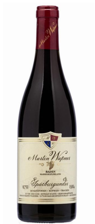
2014 Spätburgunder trocken