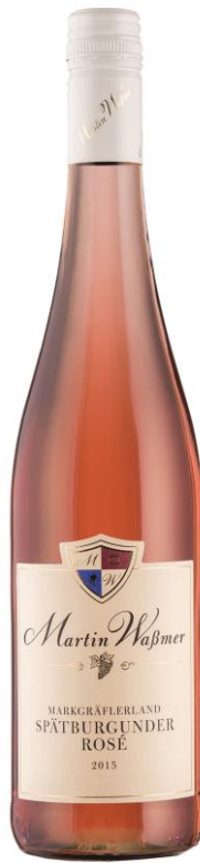
2015 Spätburgunder Rosé Kabinett feinherb